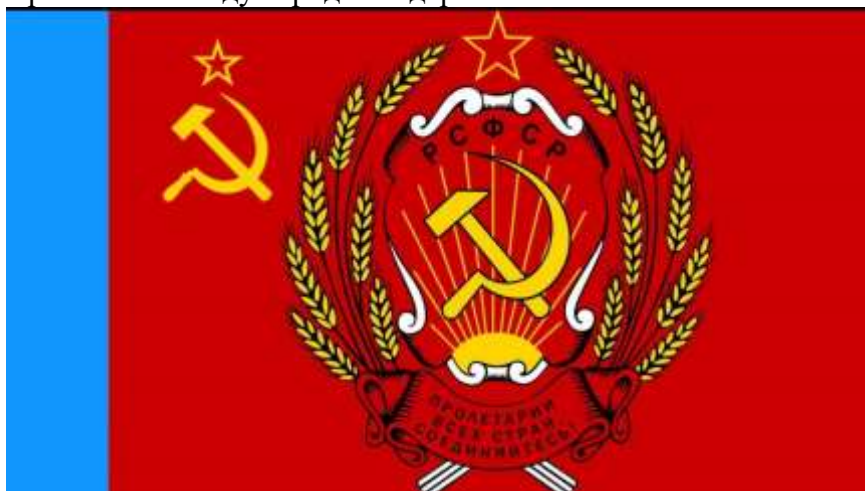
Рис. 5. Герб РСФСР