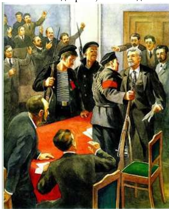
Рис. 4. «Караул устал!»

Такое решение депутатов Учредительного собрания только сыграло на руку большевикам, которые, дождавшись резкого и критического выступления Ленина, покинули зал заседаний. Следом за ними после бурного и малопродуктивного обсуждения иных процедурных вопросов, сопровождавшегося не только скандалами и потасовками, но и угрозами оружием, что пару раз едва не привело к стрельбе, ушли и эсеры. Собрание лишилось кворума, и с этого момента его деятельность была уже бессмысленной. Тем не менее оставшиеся участники заседания решили продолжить работу и успели принять закон о земле, согласно которому она становилась общенародной собственностью, обращение к воюющим державам с призывом не допустить сепаратных мирных переговоров, и провозгласить Россию федеративной республикой. Впрочем, все эти решения уже ни на что не влияли, поскольку либо повторяли первые большевистские декреты, либо входили в противоречие с ними.