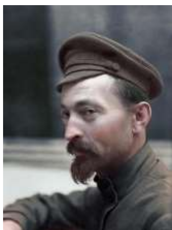
Рис. 7. Глава ВЧК Ф. Э. Дзержинский Его называли «железным Феликсом» и «рыцарем революции» за идейную стойкость, непреклонность и удивительную работоспособность. Он создал одну из самых страшных, но эффективных организаций в России — ВЧК.

7 декабря 1917 г. СНК принял постановление об образовании ВЧК (Всероссийской чрезвычайной комиссии) при Совнаркоме по борьбе с контрреволюцией и саботажем. Возглавил Ф. Э. Дзержинский (рис. 7).