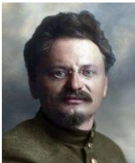
Рис. 6. Народный комиссар по военным делам РСФСР Лев Троцкий Железная дисциплина в сочетании с активной пропагандой революционных идей и борьбы с оккупантами стали залогом успеха РККА на Восточном, Южном и Западном фронтах. К 1920 г. большевики отвоевали богатые природными ресурсами регионы, что позволило обеспечить войска продовольствием и боеприпасами.

Огромный вклад в становление Красной армии внёс народный комиссар по военным делам РСФСР (с 17 марта 1918 г.) Лев Троцкий. Он устранил любые послабления, восстановив авторитет командиров и практику расстрелов за дезертирство (рис. 6).