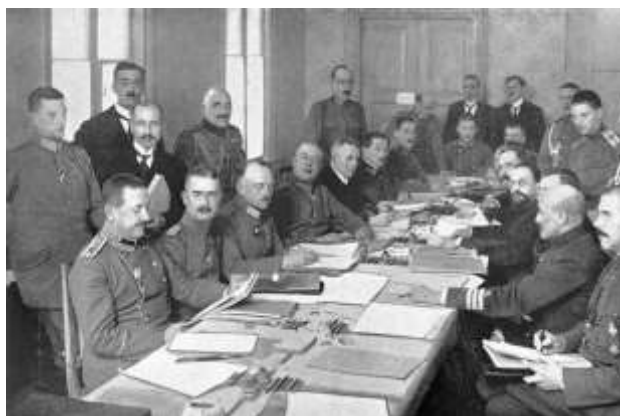
Рис. 8. Подписание Брестского мира

В феврале 1918 г. немцы начали наступление по всему фронту. Остатки наполовину разошедшейся русской армии почти не оказывали сопротивления. Было объявлено о создании добровольческой рабоче-крестьянской Красной армии (именно тогда в неё записались многие бывшие царские офицеры). Однако под угрозой захвата Петрограда немцами В. И. Ленин убедил Совнарком подписать мир на любых условиях (рис. 8).