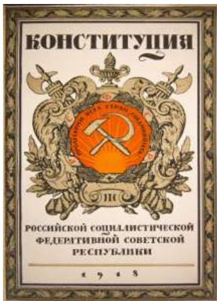
Рис. 9. Первая конституция России