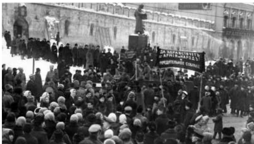
Рис. 3. Митинг на Лубянской площади.

Несмотря на эти трагические события, депутаты Учредительного собрания решили не отменять первого заседания. Оно открылось с большим опозданием, только в пятом часу вечера: ждали представителей фракций большевиков и левых эсеров, составивших межфракционный союз. И с первых же минут стало очевидно, что рассчитывать на нормальную работу депутатам не приходится.