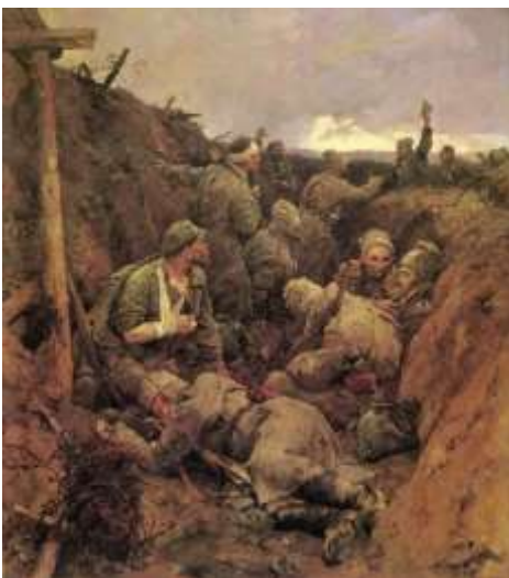
Рис. 1. «Декрет о мире» В. Серов

Второй съезд Советов принял написанные Лениным первые декреты советской власти — о мире и о земле. Декрет о мире предлагал немедленное прекращение боевых действий и заключение мира без аннексий и контрибуций . Это отвечало стратегическим планам Германии, которая могла избавиться от боевых действий на Востоке (рис. 1)